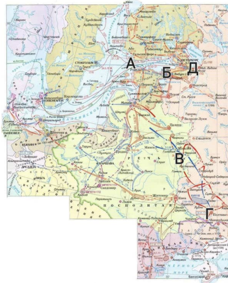
Рисунок 1. Карта войны

Задание 5. Внимательно изучите карту, планы и выполните задание. (16 баллов)