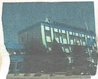
Здание в Армавиру. Армавирский завод, территория. Снимок сделан в 2008 году.

ОАО «ЭПТЕЗА» — это многопрофильная компания, выпускающая современное электротехническое оборудование, электронные и микропроцессорные устройства, а также системы управления движением поездов и обеспечения безопасности железнодорожных перевозок. ОАО «ЭПТЕЗА» — первое дочернее общество ОАО «РЖД», основано в 2005 году на базе профильных заводов-производителей средств автоматики и телемеханики для железнодорожного транспорта, история которых насчитывает более 100 лет.